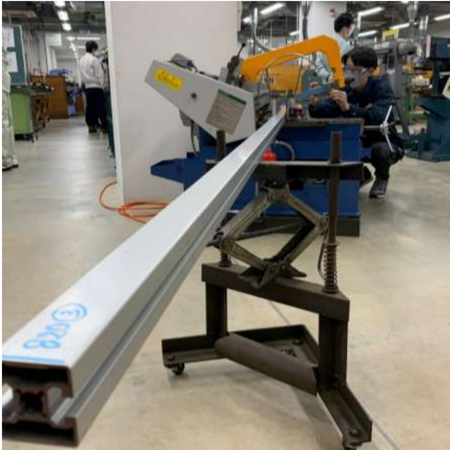
図1 フレーム治具製作の様子